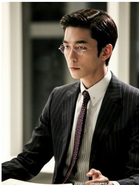
Leinas (aktoriaus Shin Sung Rok, tarimas Šin Songrok)